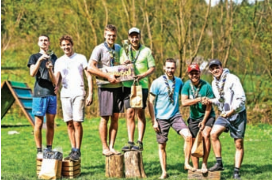
Najboljše tri ekipe: prvi in tretji so bili Novomeščani, druga pa ekipa iz Velenja.

Bilo je navadno oblačno jutro, ko so se klanovci stega Železniki 1 (člani Rafaklana) zbrali na prostoru za agility v Selcih, da bi pripravili še zadnje podrobnosti pred začetkom svojega najnovejšega vseslovenskega dogodka. Ideja o turnirju v spikeballu je že dolgo tlela v njihovih srcih, saj so izjemno igro, ki z mrežico, žogico in pravilom treh podaj spominja na nekakšno pritlehno odbojko, igrali že več let. Idejo so 29. aprila končno uresničili. Zjutraj so pripravili vse potrebno: sezuli čevlje, saj je izkušnja igre z bosimi nogami magična, napeli mreže, da bi se žogice čim bolje odbijale, in narezali meso in zelenjavo, da bi bil ričet za kosilo skuhan ob pravem času. Kmalu so začele prihajati prve ekipe, prvi obiskovalci, soigralci, nasprotniki – kakorkoli jih želite imenovati. Iz Velenja in Novega mesta sta