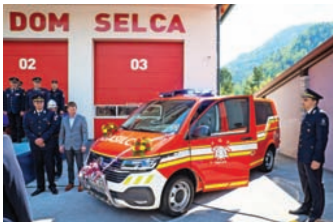
Velika pridobitev je tudi kombi za prevoz moštva GVM-1.

Prvi gasilski dom v Selcih je bil zgrajen leta 1910, odprtje novejšega pa so dočakali leta 1985, a sta prostorska stiska in stalna vlaga vodili v želje po novejšem gasilskem domu. Leta 2012 je upravni odbor PGD Selca sprejel sklep, da se ustanovi komisija za izgradnjo novega gasilskega doma. Že naslednje leto je PGD z lastnimi sredstvi kupil zemljišče. Gradbeno dovoljenje za nov dom je bilo izdano leta 2017 in še isto leto so postavili dom, zgrajen iz križno lepljenega lesa. Najprej so uredili pritličje in medetažo in se tako aprila 2019 preselili v nov dom. Nato so se lotili še izdelave prvega nadstropja in podstrešja ter fasade in dvorišča. Zadnja dela so končali lani, 30. aprila letos pa so pridobili tudi uporabno dovoljenje.