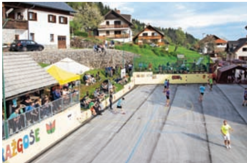
S turnirja v futsalu v Dražgošah. V soboto, 17. junija, sledi še finalni turnir v Športnem parku Dašnica.

Na koncu se Športno društvo Dražgoše zahvaljuje vsem ekipam, ki so prišle na turnir in prikazale lepe predstave. Turnir je bil lepa reklama za futsal in upamo, da smo navdušili kakšnega mladostnika za ukvarjanje s tem športom. Opažamo namreč, da se vse manj mladostnikov po 16. letu ukvarja s športom, kar je izjemno skrb vzbujajoče. Zato so take športne prireditve zelo pomembne za celotno Selško dolino. Lepo vabljeni na preostali turnir v seriji, že zdaj pa naj velja tudi povabilo na naš turnir v naslednjem letu.