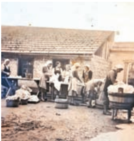
Perice za Kalanovo hišo v Selcih

Kot je pojasnila Rovtarjeva, so na idejo o razstavi prišli ob zbiranju gradiva za zbornik, ki ga pripravljajo ob 1050-letnici Selc. Naleteli so namreč tudi na zanimive stare fotografije, a vseh ne bo možno vključiti v zbornik, hkrati pa je dejstvo, da jih imajo še pri marsikateri hiši; hranijo jih po škatlah, a se dogaja, da jih nato čez leta zavržejo in so za vedno izgubljene. »Želele smo, da bi se ohranilo čim več starih fotografij,« je dejala Rovtarjeva. Objavili so poziv domačinom, naj jih prispevajo oz. posodijo za razstavo, avtorice pa so se tudi osebno odpravile do posameznikov, za katere so predvidevale, da hranijo zanimivo gradivo. Tako so prišle do številnih starih fotografij, ki se bodo v digitalni obliki ohranile za naslednje rodove.