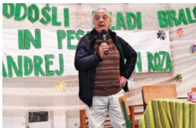
Pesnik Andrej Rozman - Roza med nastopom v telovadnici OŠ Železniki

Zgodba letošnjega 'branja za značko' se je dogajala med 17. septembrom 2022 in 2. aprilom 2023, ko se na mednarodni dan knjig za otroke uradno konča. Izziv je letos opravilo 531 učencev, med njimi 49 devetošolcev, ki so vztrajno brali vsa osnovnošolska leta.