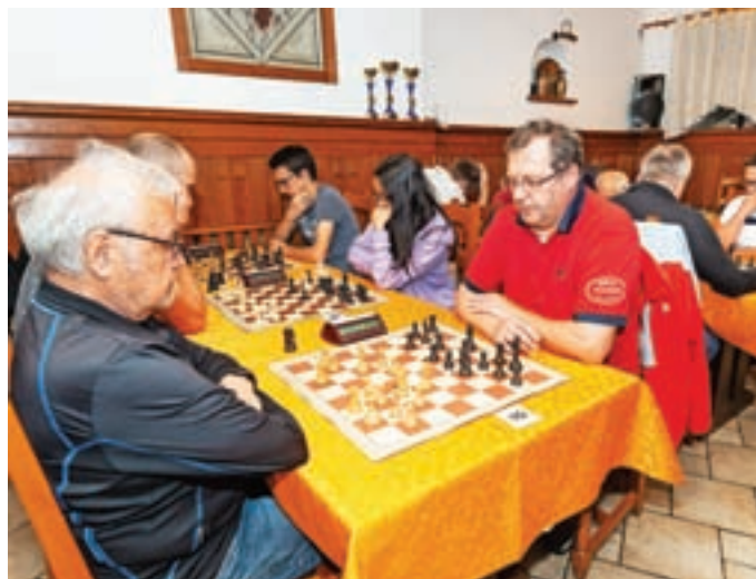
Na turnirju se je pomerilo 29 šahistov.