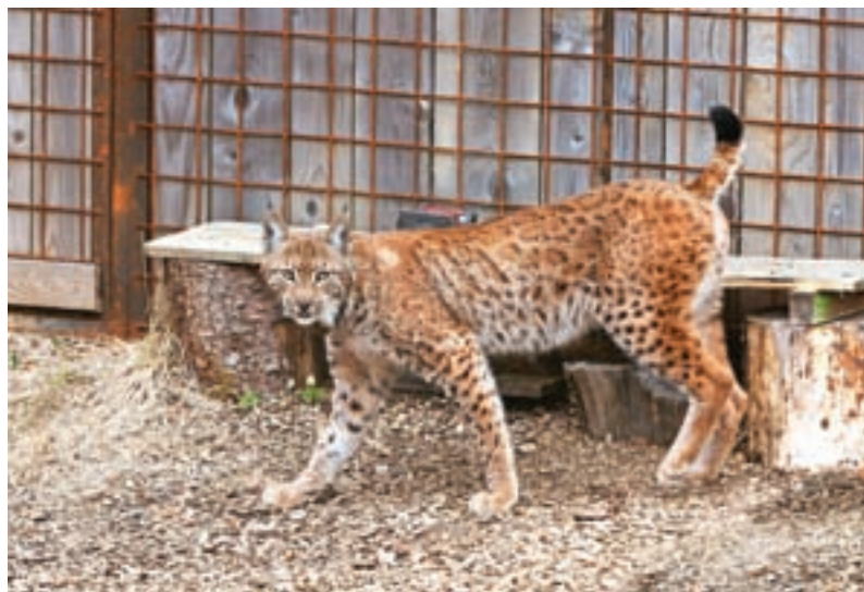
Ris Lukaš iz Slovaške je bil iz obore LD Nomenj Gorjuše izpuščen 19. aprila letos.

Preko zanimivih risjih zgodb želimo njihovo življenje približati tudi vam, saj je srečanje z risom v naravi izjemna redkost. Risi so zelo plašne živali in se ob prisotnosti človeka običajno takoj umaknejo, zato za človeka niso nevarni. Vsak