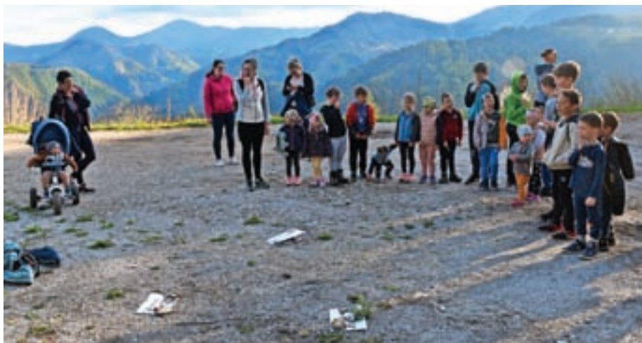
Čakale so nas različne naloge, ki smo jih brez težav opravili.