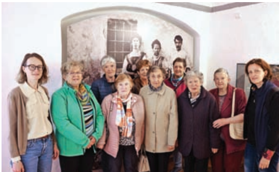
Klekljarice na obisku v Muzeju Železniki

Muzejska vrata smo za obiskovalce na široko odprli 18. maja, ko zaznamujemo mednarodni muzejski dan. Ker je klekljanje pomemben del identitete krajev ob Selški Sori, čipke pa so v našem muzeju na ogled že od leta 1969, smo tokrat na obisk prijazno povabili klekljarice, ki so kot sekcija združene v Turističnem društvu Železniki. Z njimi pogosto sodelujemo, namen tokratnega srečanja pa je bilo druženje. Skupaj smo si ogledali čipkarsko zbirko, po