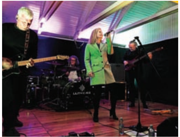
Četrto koncertno serijo Vidra ni riba je odprla zasedba Lilith Cage.

V soboto, 20. maja, so nas nato obiskali Bluzon iz bližnje Škofje Loke, zdaj pa se za tretjo Vidro, 17. junija, že pripravljamo na koprsko »pantalone« oziroma »spotikave nerodneže«, kot si sami pravijo. In sneg na Ratitovcu je medtem tudi že skopnel. Trio Pantaloons se je z glasbenimi melodijami in ritmi sprva poigral v obliki »jam sessionov«, njihova avtorska glasba pa je svoj prostor pozneje našla v elektronski plesni glasbi, začinjeni z ritmi jazz, funka, breakbeata, dubstepa in še česa. »Navihani, dobro uigrani, predvsem pa plesno razpoloženi Pantaloons so eden tistih bendov, ki te nikakor ne pusti ravnodušnega,« jih je opisal eden od festivalov MENT, kjer so kar nekajkrat nastopali. Lepo vabljeni vsi v soboto, 17. junija, zvečer na bazen. In še namig: pridite najkasneje do pol devetih, da ne zamudite polovice koncerta!