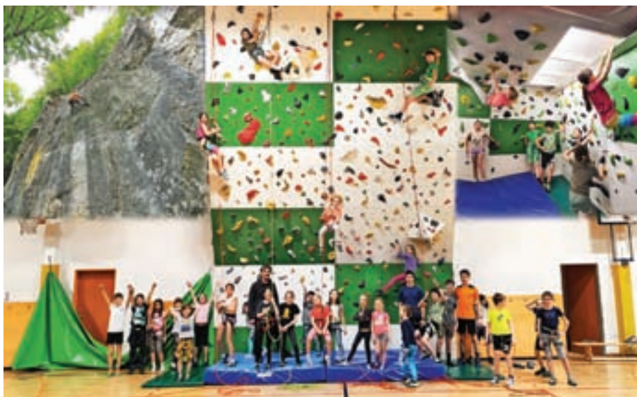
Po izgubi naravnega plezališča pod Sušo bodo povečali plezalne površine v telovadnici OŠ Železniki.