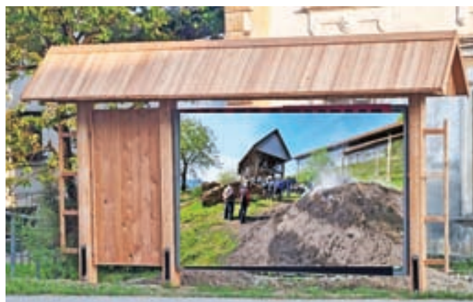
Nova promocijska in plakatna tabla v Selcih

Lepa, res lepa je Selška dolina ... To so že skoraj ponarodele besede, njihovega pomena pa se vse bolj zavedajo domači in tuji obiskovalci, ki se vsako leto v večjem številu odločajo za obisk. Preplet naravne in kulturne dediščine je izjemen in daje