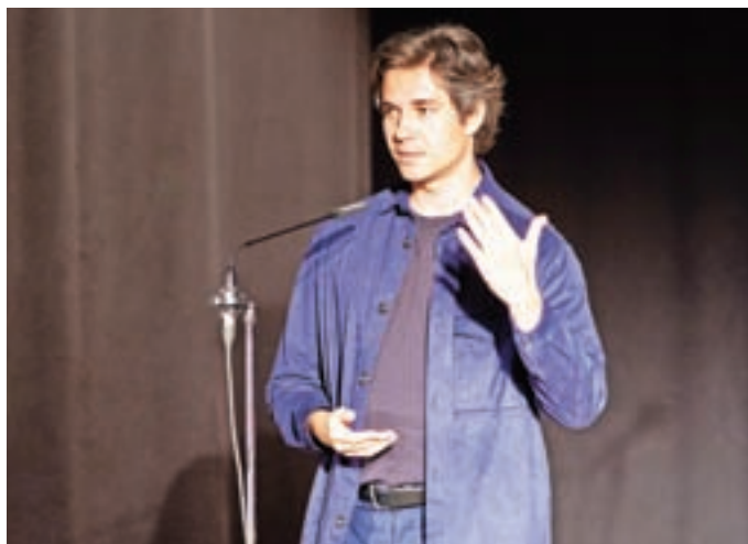
Osrednji govornik je bil minister za delo, družino, socialne zadeve in enake možnosti Luka Mesec.

Program na proslavi, ki je bila v Kulturnem domu Železniki, so sooblikovali člani KUD France Koblar z recitacijami, Francetovi orgličarji in posebna gostja, igralka ter pevka Lara Jankovič. Osrednji govor je imel minister za delo, družino, socialne zadeve in enake možnosti Luka Mesec. »Če 27. aprila zaznamujemo boj za politično svobodo, boj proti okupatorju, boj za samobitnost, da lahko kot narod sami odločamo o svoji svobodi, 1. maja bojujemo boj za ekonomsko svobodo.« Minister meni, da je eno ključnih vprašanj za prihodnost razmerje med delom in prostim časom: »Prosti čas je nekaj, kar sicer jemljemo kot nekaj samoumevnega, pa ni tako. Ključno je, koliko prostega časa si lahko vzamemo. To je pomemben del svobode.« Drugo vprašanje se nanaša na napredek tehnologije. »Pred kratkim sem bil v eni od držav tretjega sve-