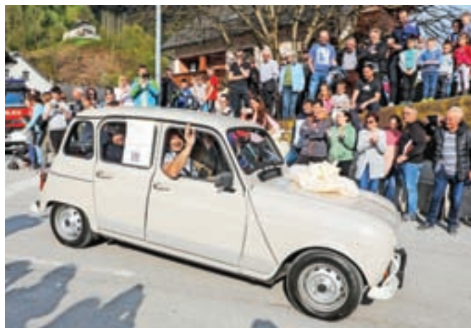
Sprejem katrce v Selcih je pritegnil številne obiskovalce.

Možne so tudi donacije s SMS-sporočili na številko 1919 s ključno besedo KATRCA5 ali KATRCA10, s čimer posameznik prispeva pet ali deset evrov.