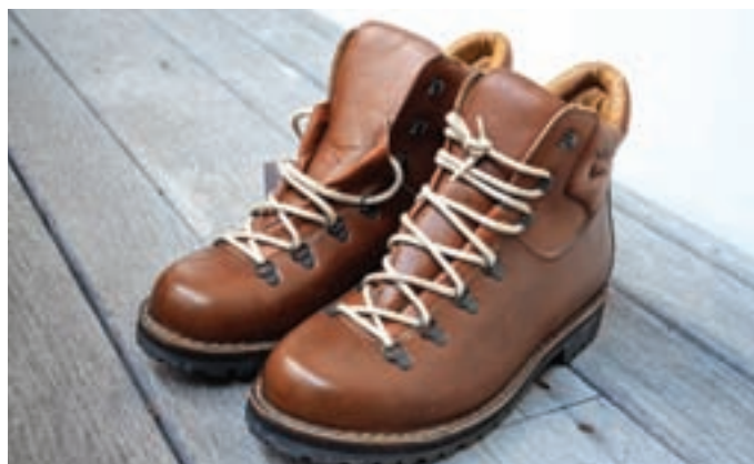
Čevlji Ratitovec

Tokrat predstavljamo predmet, ki smo ga pred kratkim pridobili za muzejsko zbirko. Poklicala nas je gospa iz Tržiča, povedala, da hrani še nenošene čevlje iz Čevljarne Ratitovec, in vprašala, ali nas zanimajo za zbirko. Ko smo se ob predaji predmeta srečali, je povedala zgodbo teh čevljev. Prvi lastnik čevljev je bil njen praded, ki je bil doma z večje kmetije iz okolice Krškega. V času med vojnama je trgoval z živino. Na teh trgovskih poteh je najbrž kupil čevlje Ratitovec Češnjica, ki pa jih ni nikoli nosil. Med drugo svetovno vojno so Nemci družino izgnali z doma in del vojne so preživeli v taborišču v Nemčiji. Po vojni so prišli nazaj na domačijo na Dolenjskem, praded je kmalu po vojni umrl. Njegova hči se je z možem v 50. letih 20. stoletja preselila v Tržič in se zaposlila v čevljarski industriji, s sabo je prinesla tudi očetove čevlje. Tako so se čevlji kot družinska dediščina prenašali naprej in zadnja lastnica, pravnik-