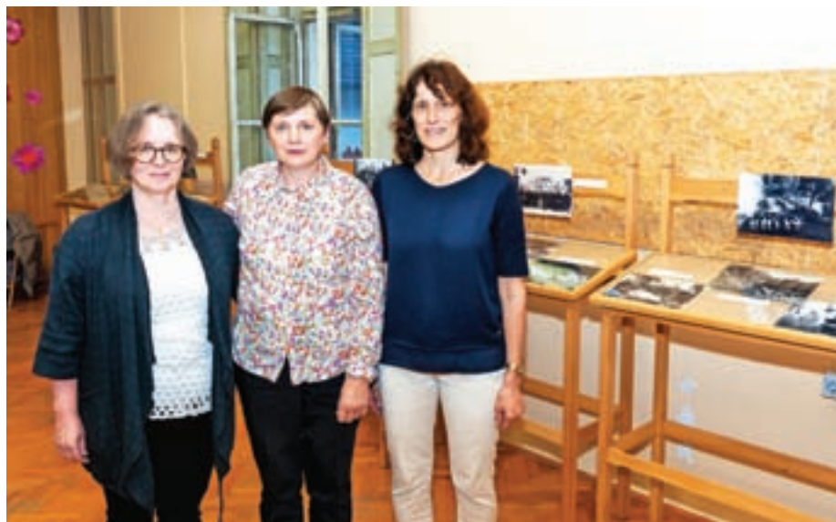
Razstavo so pripravile Marija Demšar, Marija Rovtar in Julijana Prevc.